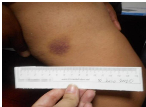
Equimosis en muslo derecho