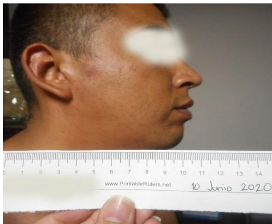
Equimosis en hemicara derecha