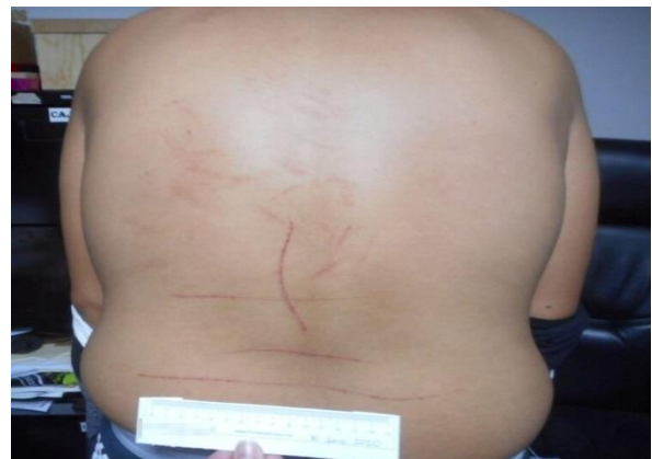
Excoriaciones en región dorsolumbar