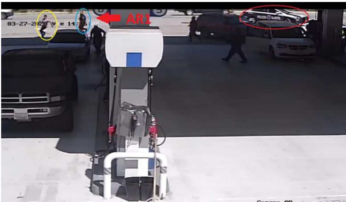
Rojo: unidad de la Policía Municipal. Azul: AR1, policía municipal. Amarillo: V1.

6. Por lo anterior, personal de la estación de gasolina, solicitó la presencia de una unidad policiaca para que brindaran apoyo, arribando al lugar aproximadamente a las 14:30 horas AR1 y AR2 (elementos policiales adscritos a la Sspcm) quienes sometieron a V1 en el suelo, lo esposaron con las manos hacia atrás, asegurándolo de los pies AR2, mientras AR1 le presionaba el cuello con el pie, lo que ocasionó que perdiera la vida. Como se muestra en las imágenes siguientes: